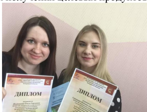
На фото: участники конференции на базе среднетехнического факультета ФГБОУ ВО «Кемеровский технологический институт пищевой промышленности (университет)»