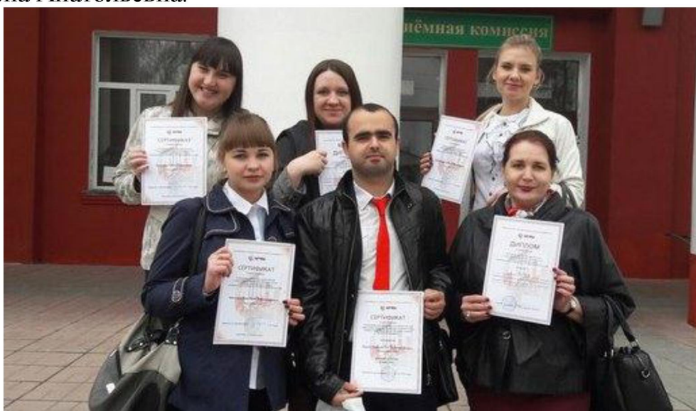
На фото: представители Кемеровского ГСХИ на конференции