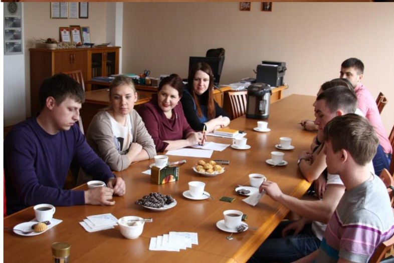
На фото: заседание студенческого научного общества

Представители Совета молодых ученых принимали участие с 11 по 14 мая 2016 года в Новосибирске прошла вторая акселерационная программа для инновационных проектов и идей ранней стадии реализации "Инитиум"!