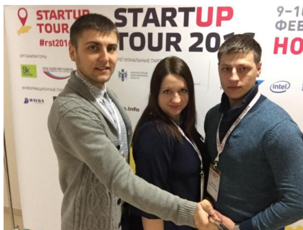
На фото: Участники Кемеровского ГСХИ в стартап туре Сколково 2016

Все участники конкурса были приглашены для участия в Startup Village 2016, который пройдет 2-3 июня в городе Москва, а также рекомендованы для участия в конкурсе грантовой поддержки СТАРТ, организованном Федеральным Фондом содействия развития малых форм предприятий в научно-технической сфере.