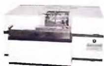
АТОМНО-АБСОРБЦИОННЫЙ СПЕКТРОФОТОМЕТР МГА 915МД