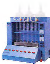
АНАЛИЗАТОР КЛЕТЧАТКИ АКВ-6