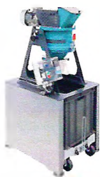
ИСТИРАТЕЛЬ ПОЧВЫ ИП 1 «ПОЧВОМАШИНА»